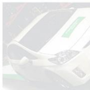
Presque 130 m pour la Prius, + 64 % grâce au pneu « proto » de Nokian.

☛ CGS-Continental. CGS s'élève au niveau sonore des roues motrices. Sous la marque Conti produit aussi des RM sous Cultor, Mitas et Euzkadi) il y a le tir de SilentSpeedTyre. Au répond à un besoin du marché où l'on peut rouler sur route. A cette allure le niveau sonore gêne les conducteurs d'où ce pneu réduisant les vibrations perçues dans la cabine de 3 à une diminution de plus Homologué pour 70 km/h, différence esthétique avec conventionnels, ce SST n'est tant produit qu'en 2 dimensions, 650/65R et 600/65R.